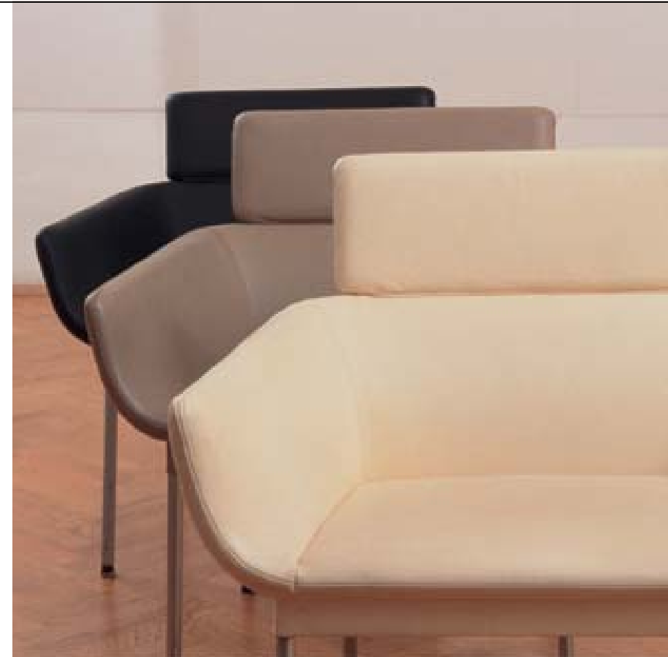
Scoop für Walter Knoll, entworfen von EOOS

„Design ist eine poetische Disziplin“, umreißt Gründl seine Unternehmensphilosophie. Was heißt das? Im Design von Alltagsgegenständen drückten sich seit Urzeiten menschliche Ängste und Sehnsüchte aus. Objekte erzählten viel über die Menschen, die sie verwenden. Für das EOOS-Team