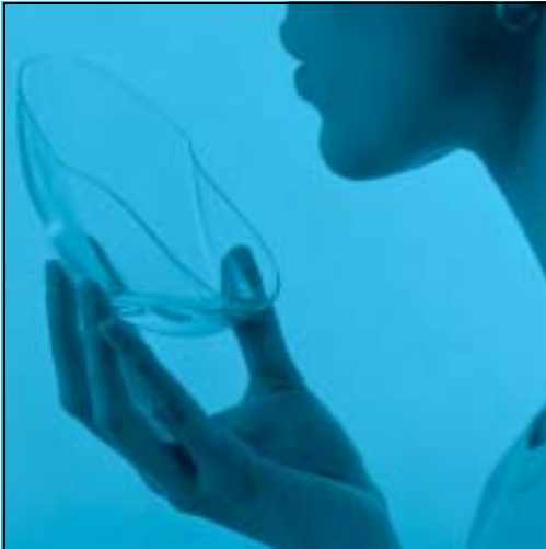
Liquid Skin, LUCY.D